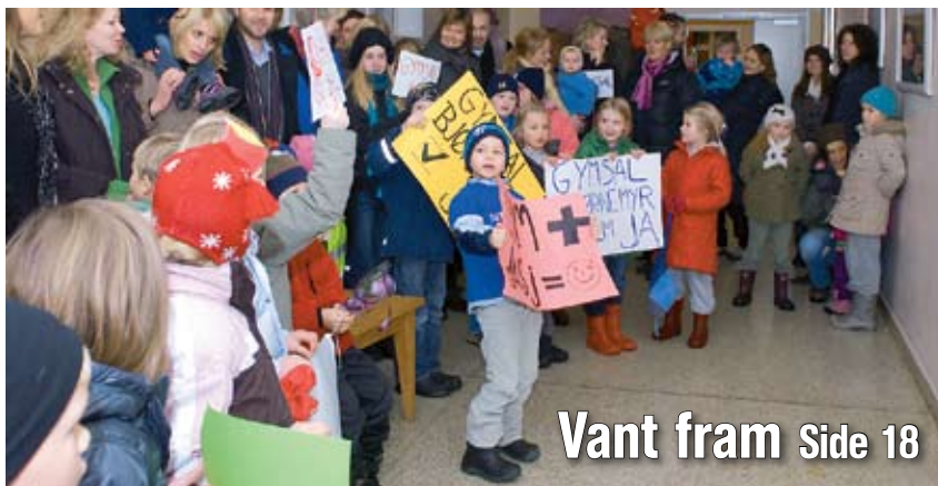
Vant fram Side 18