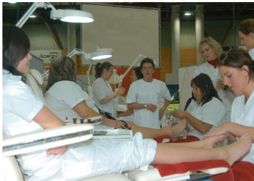
MÅ SE SAMMENHENG: Motivasjon for læring skapes ved at elevene ser sammenhengen mellom teori og praksis, mener skribenten.

I L'97s generelle del (sammenfallende med opplæringsloven og stortingsmeldinger) står det at læring skal