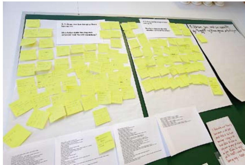
DEMOKRATI: Alle ansatte får si sin mening under møter.

Uka etter er vi på vei til Nordli barnehage i Sørums kommun. I 31 år